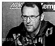
Sigurdsson optimistisch vor Handball-WM