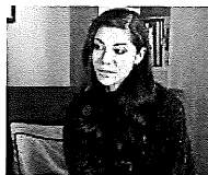
Weihnachten mit Christina Perri