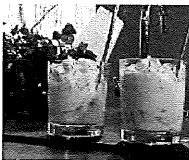
Das perfekte Weihnachtsmenü - Das De...