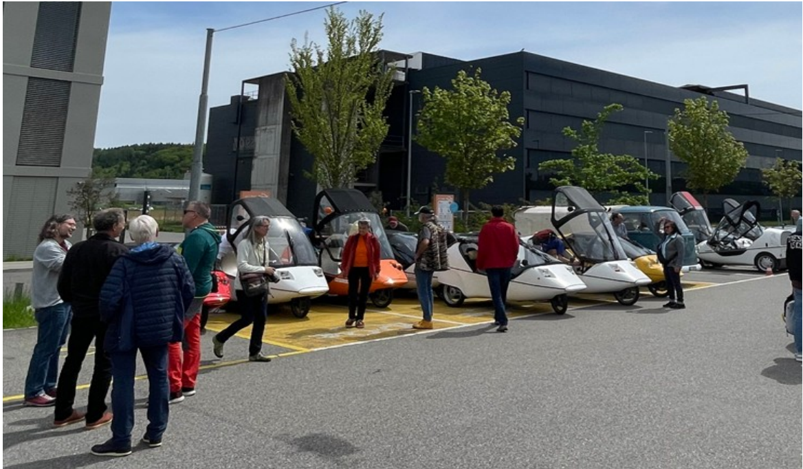
2024 – Twikeklub Generalversammlung bei MPS AG